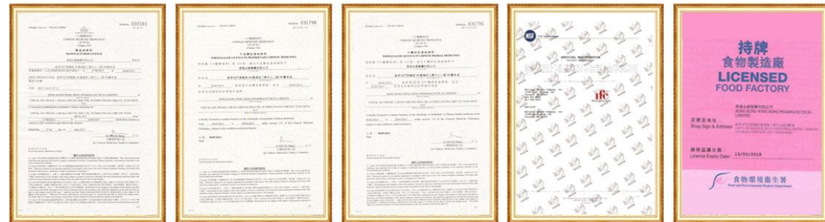
中成藥製造商牌照

Ngoài ra có chứng nhận xưởng chế tạo thực phẩm của BỘ Y tế và Môi trường thực phẩm của Hong Kong cấp